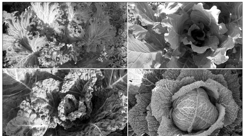
A la part superior, cols no cabdellades: espiguellat (esquerre) i arrissada d'hivern (dreta). A la part inferior, cols cabdellades: farratgera (esquerre) i pell de galàpet (dreta).